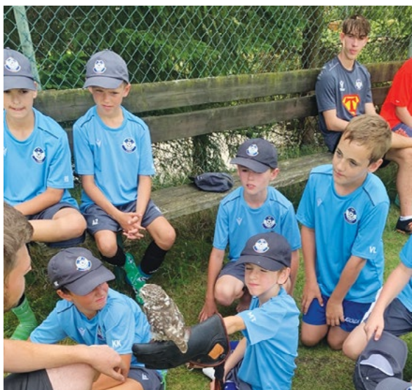
Návštěva sokolníka na Příměstském fotbalovém táboře TJ Klíneč 14. 8. 2023