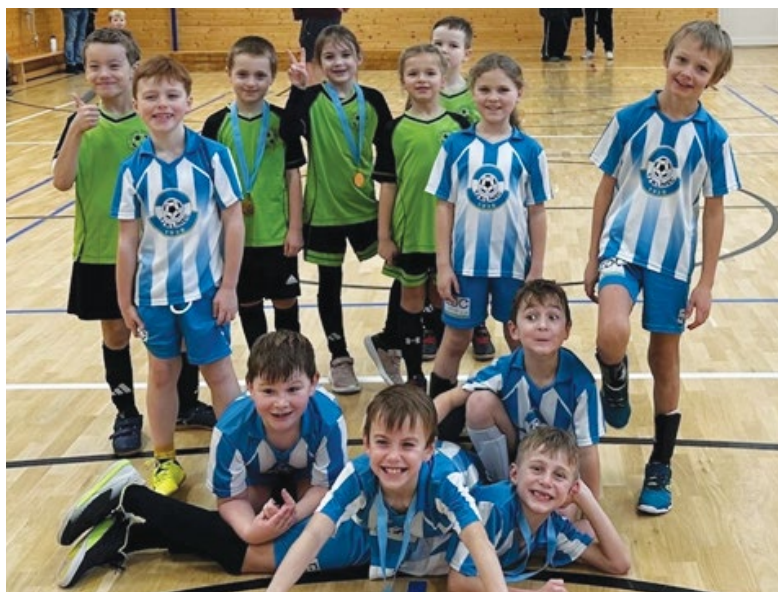
Momentka ze zápasu Elévů TJ Klíneč v Čisovicích 3.2.2024