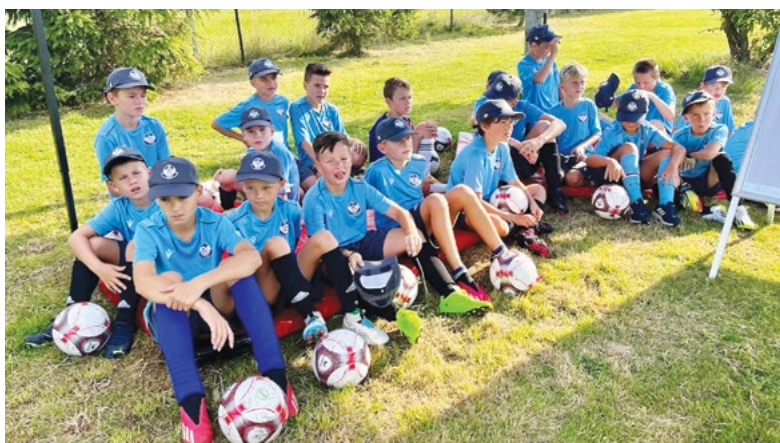
Odpočinek po tréninku během Příměstského fotbalového tábora TJ Klíneč 16. 8. 2023