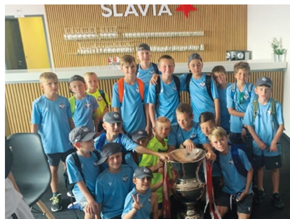
Exkurze na stadion SK Slavie během Příměstského fotbalového tábora TJ Klíneč 16. 8. 2023