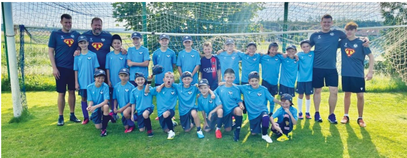
Účastníci Příměstského fotbalového tábora TJ Klíneč 14. 8. 2023