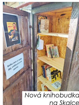
Nová knihobudka na Skalce