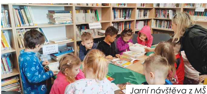
Jarní návštěva z MŠ