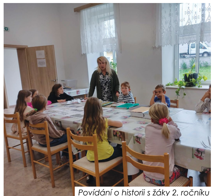
Povídání o historii s žáky 2. ročníku