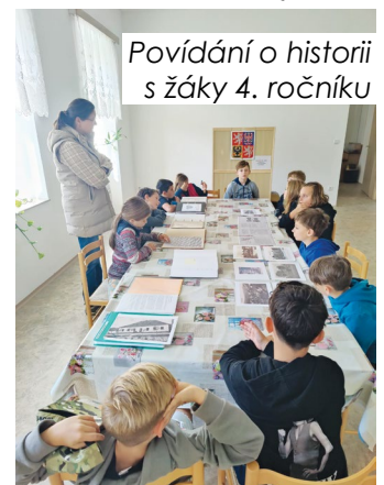
Povídání o historii s žáky 4. ročníku